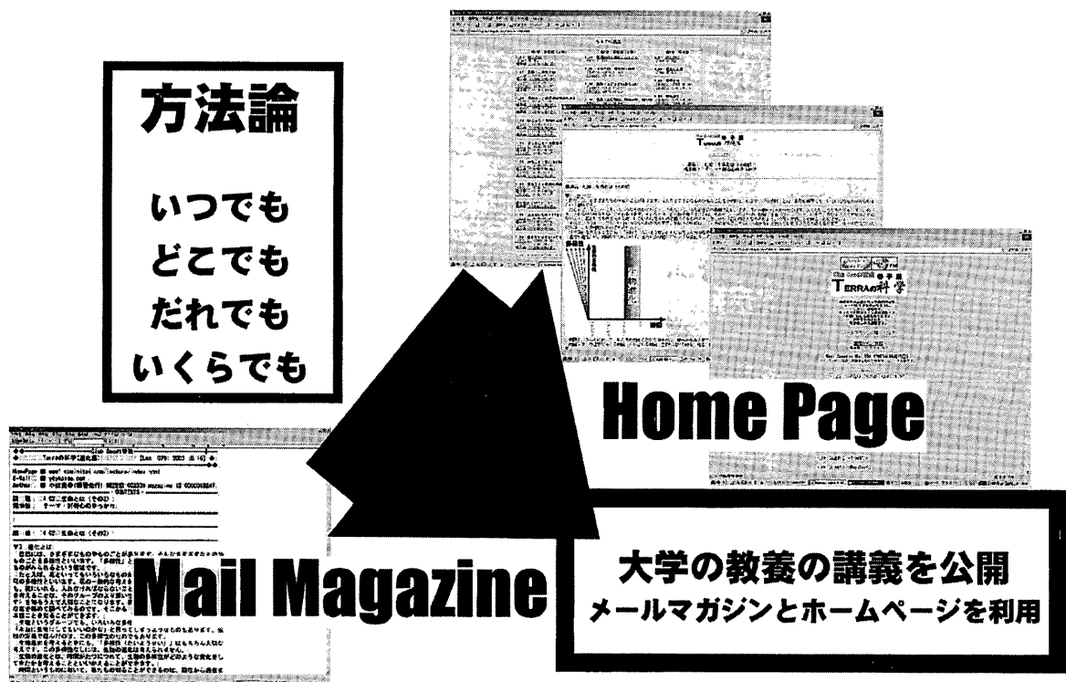
本研究で用いた方法論の概念を示している。画像は、実際のメールマガジンとホームページのものを使用した。