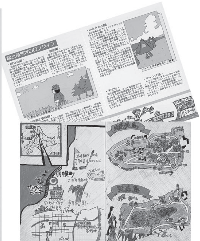
写真2 ゼミ生作成の羽幌観光ガイドブック「120%はぼろ！」

ちを曝していただろう、というものであった。調査で訪れた時、羽幌町も観光で街づくりを意識した取り組みを行っていたのは確かであるが、すこし余裕を感じたのは、市ではなく町のせいかもしれない。この年の調査は羽幌・焼尻の観光をテーマとしていたが、町内は足の便が悪かったので、観光スポットを理解してもらうためにと言うことで、町役場はマイクロバスを使わせてくれるなど随分とお世話になった。