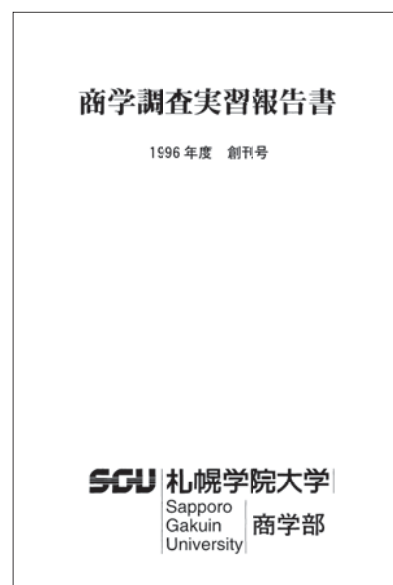
写真1 報告書創刊号の表紙

報告会の様子は、数年間ビデオに収録され各担当者に配布されていた。今、手元に1999年度から2003年度までのビデオは存在するが、それ以降のものがないことを考えると、2003年度を最後にビデオ撮影